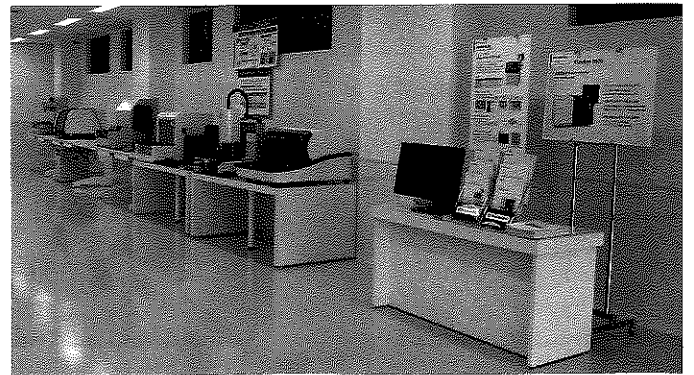
写真4 テクニカルセンター2階内部